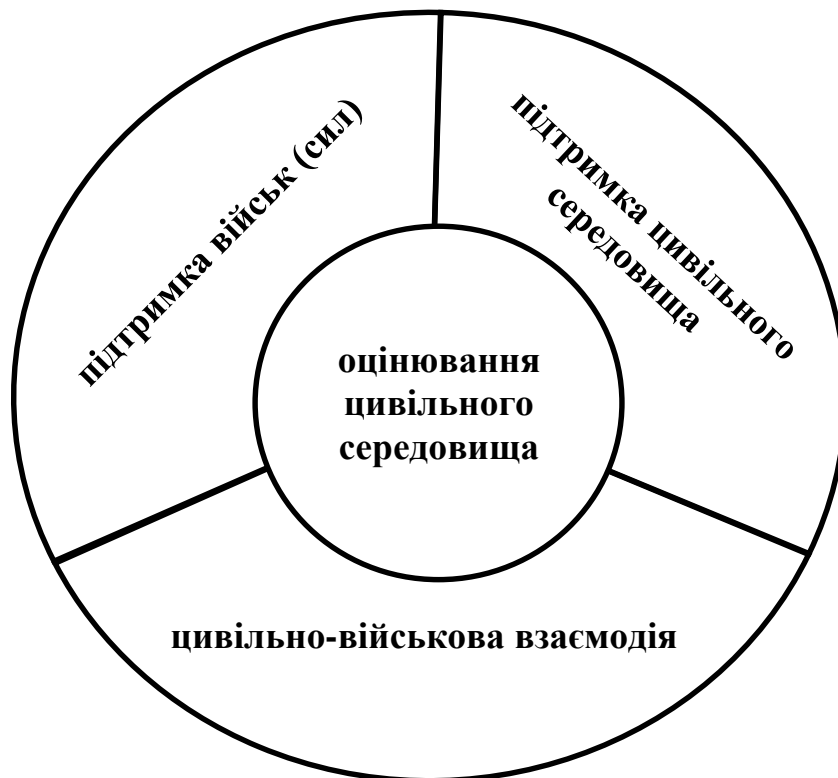
Рисунок – модель системи цивільно-військового співробітництва.

3.1.4. Система ЦВС може бути представлена моделлю яка складається з чотирьох взаємопов'язаних підсистем: цивільно-військової взаємодії, підтримки військ (сил), підтримки цивільного середовища, оцінювання цивільного середовища (див. рисунок).