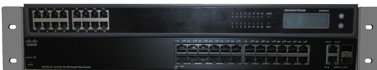
Рис. 3.2 Вигляд передньої панелі телекомунікаційного блоку

2 роз'єми вихід 12 В для підключення телекомунікаційного блоку.